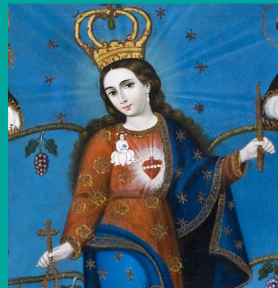
Árbol Monástico de la Orden Dominicana (detalle)

Para ello hemos convocado a una serie de profesionales y especialistas de distintos ámbitos académicos y patrimoniales, quienes entre el 15 y el 18 de noviembre, compartirán sus experiencias de trabajo e investigaciones con la comunidad general y de forma totalmente gratuita. Investigación y prácticas curatoriales principalmente desde la historia cultural. Para ello hemos convocado a una serie de profesionales y especialistas de distintos ámbitos académicos y patrimoniales, quienes entre el 15 y el 18 de noviembre, compartirán sus experiencias de trabajo e investigaciones con la comunidad general y de forma totalmente gratuita.